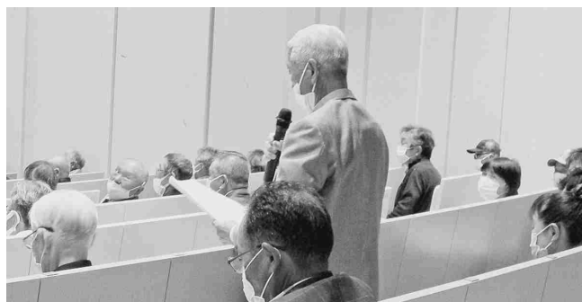
◀質疑も活発に行われました