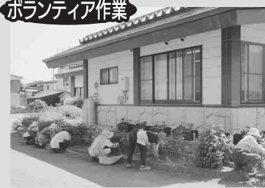
ボランティア作業