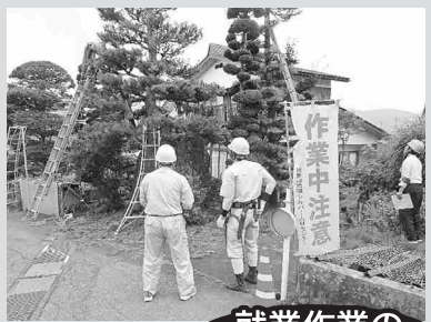
就業作業の安全パトロール