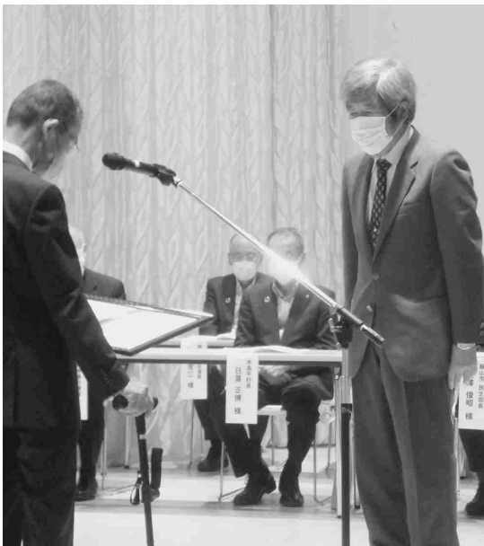
(授賞代表者 上松会員)