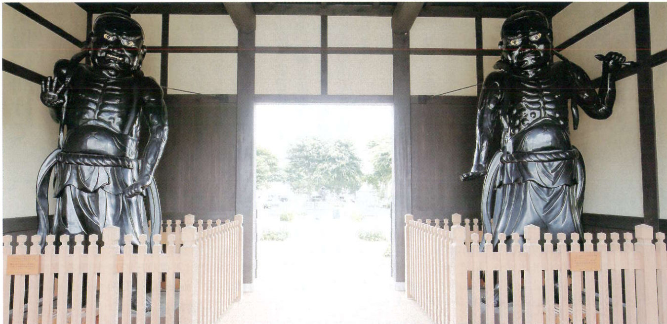
寺町シンボル広場に安置されている善光寺旧仁王門前で、善光寺仁王門再建100年と仁王像開眼100年を記念して善光寺一山住職による記念法要が4月25日に執り行われました。

発行 公益社団法人 飯山地域シルバー人材センター 〒389-2253 長野県飯山市大字飯山1461 (飯山市屋内運動場内) TEL (0269) 63-2915 FAX (0269) 67-2915