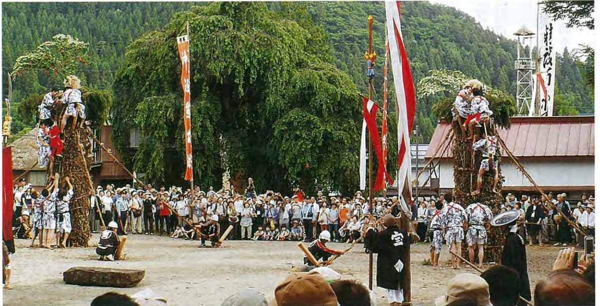
無形民俗文化財「小菅神社 柱松柴燈神車(小菅の松子)」