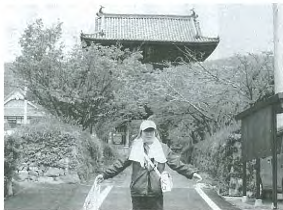
八番札所「熊谷寺」にて

先回の反省を踏まえ、ザツクの重さは七キロ以内に抑え、足回りは軽登山靴、少々お金がかかる「宿」泊りに決める。二回目の区切り。その